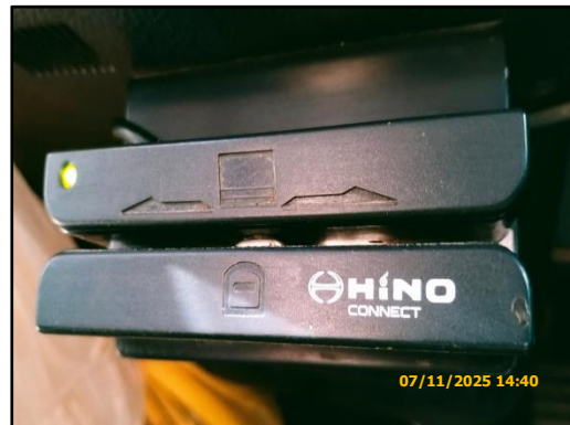
ภาพที่ 2.15 รถบรรทุกปิดคลุมผ้าใบและติดตั้งระบบติดตาม GPS