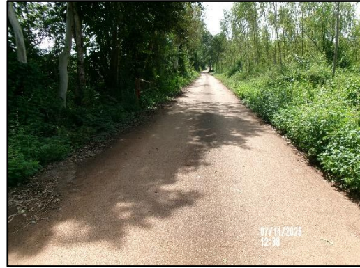
ภาพที่ 2.14 เส้นทางลำเลียงแร่ภายในโครงการ