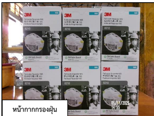
หน้ากากกรองฝุ่น