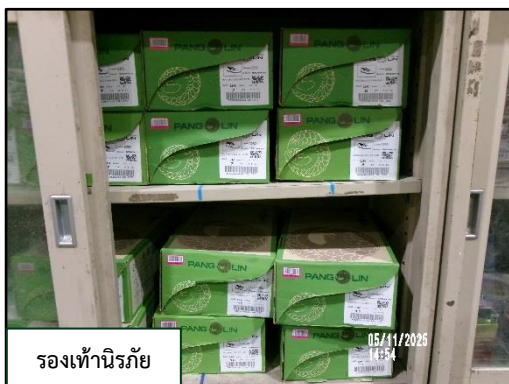
รองเท้านิรภัย