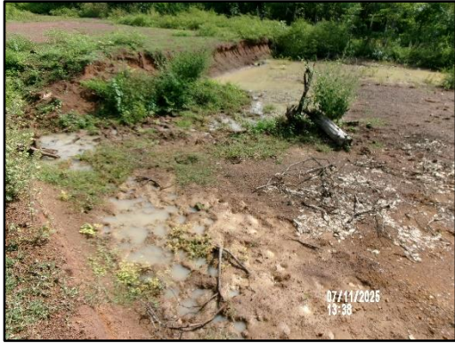
ภาพที่ 2.13 บ่อรับน้ำ Sump บริเวณพื้นที่โครงการ