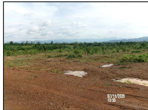
ภาพที่ 2.10 สภาพปัจจุบันของพื้นที่โครงการ