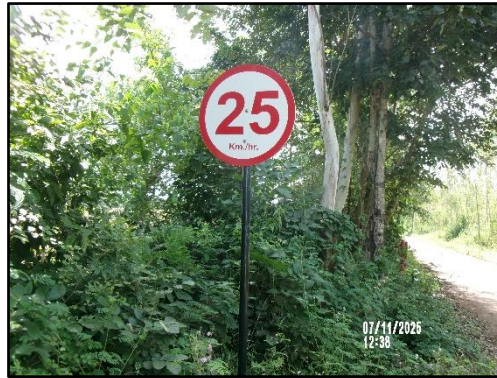
ภาพที่ 2.11 ป้ายจำกัดความเร็วไม่เกิน 25 กิโลเมตร/ชั่วโมง