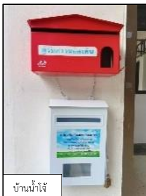
บ้านน้ำใจ