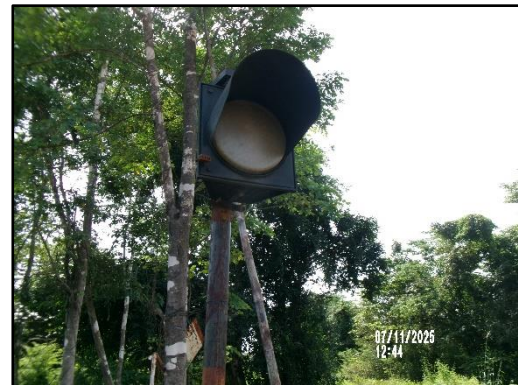
ภาพที่ 2.6 สัญญาณจราจรไฟกระพริบทางเข้า-ออกของพื้นที่โครงการ