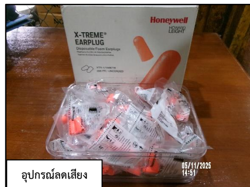
อุปกรณ์ลดเสียง