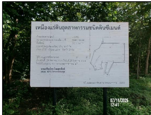
ภาพที่ 2.9 ป้ายประทานบัตร