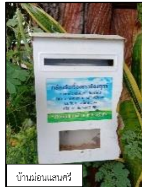
บ้านมอนแสนศรี