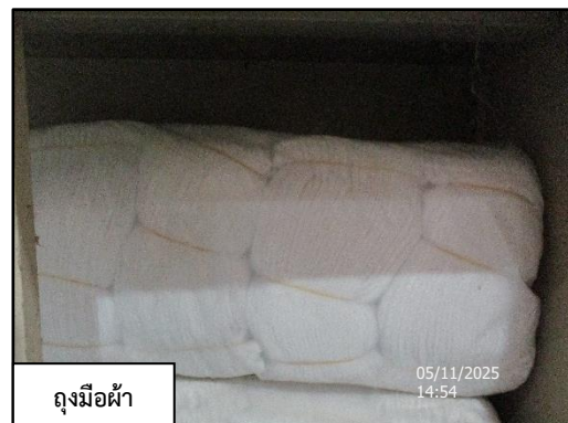
ถุงมือผ้า