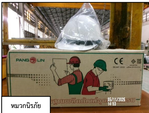
หมวกนิรภัย