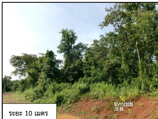
ระยะ 10 เมตร