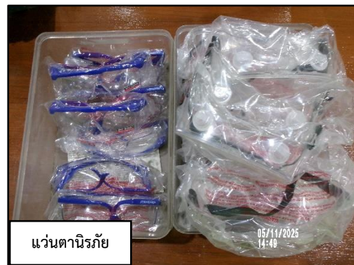
แว่นตานิรภัย