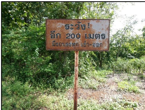
ภาพที่ 2.5 ป้ายสัญญาณจราจรมีรถขนส่งแร่เข้า-ออก ของพื้นที่โครงการ