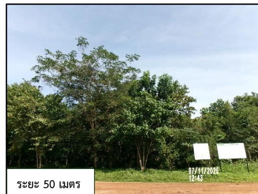
ระยะ 50 เมตร