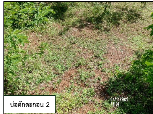
ภาพที่ 2.4 บ่อดักตะกอน 1 และ 2