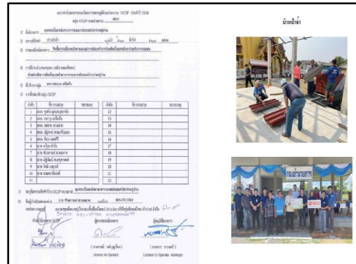
ภาพที่ 2.16 กิจกรรมการมีส่วนร่วมกับชุมชน