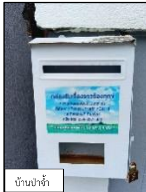
บ้านป่าจ้ำ