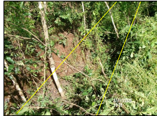
ภาพที่ 2.3 คันดินและคูระบายน้ำพื้นที่โครงการ