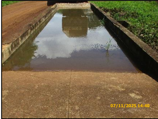
ภาพที่ 2.7 บ่อล้างล้อรถบรรทุกที่ขนส่งแร่